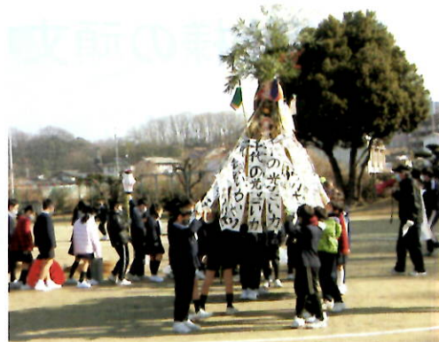
子どもとんど作り体験会の風景

まちづくり推進委員会では、少しでも地域活動に参加してもらうと、季節ごとに行事を開催しております。盆踊りや秋の文化祭・芸能祭やとんどが主な行事ですが、将来に続けていくには後継者の育成が急務といえます。後継者作りの一環として、子ども達にとんど作りの楽しさを感じてもらおうと、小学3年生の総合学習の授業時間を利用して、子どもとんど作りの体験会を実施しています。