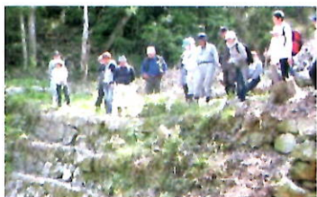
芦田大谷砂留現地研修の様子(現調査約200基)

そのほか、二〇一七年からは、芦田大谷砂留整備作業を行っています。先人の豊かな経験と優れた知識・土木技術によって築造された砂留は今現在も役立っており、「里山の名所」になるよう保存活動をしたいと思っています。