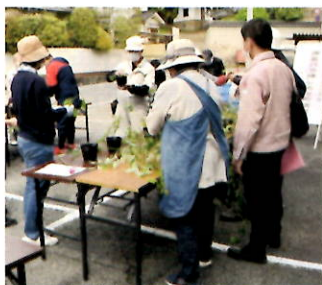
挿し木作業の様子

また、廉塾には古く中国から渡来した、年に数回咲く庚申(こうしん)バラがあります。二〇二五年に福山で世界バラ会議が開催されますので、地域に咲くバラで迎えようと、挿し木を行い、十一月に地域に配布する予定です。