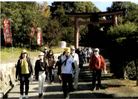
歴史散策ウォークの様子

少しでもたくさんの人に「神村町の魅力」を知ってもらおうと、「神村ふるさとガイドマップ」が作成されました。学区内を「東・西・中央・北」の四ブロックに分けて一年に一ブロックを巡る、「歴史散策ウォーク」を八年にわたり実施しました。この「歴史散策ウォーク」には、福山大学から毎回多くの学生さんが授業の一環として参加されました。