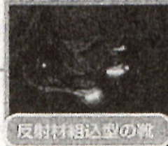
反射材組込型の靴