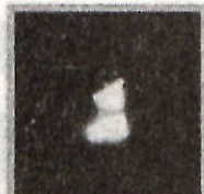
反射キーホルダー