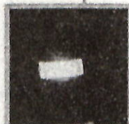
反射リストバンド