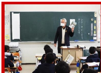
(園尾地域文化部会長さんのお話)