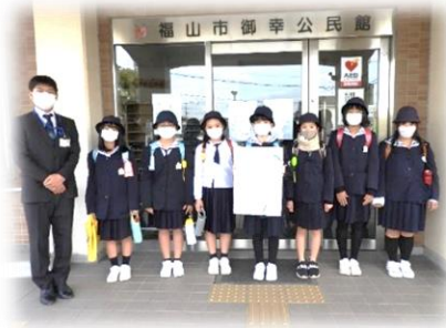
(「きれい環境グループのみなさん」)