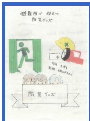
(各レポートの表紙)