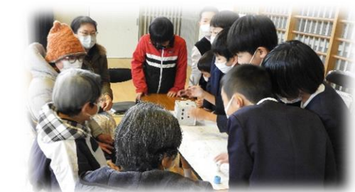
(人生ゲームブース)