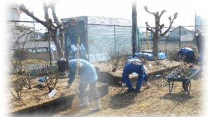
（正戸の作業の様子）

森脇中公園では、あいにくの雨の中での講習会となりましたが、参加者は5月にきれいな花を咲かせるため、真剣に剪定作業に取り組みました。