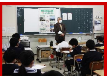
(秋山地域安全部会長さんのお話)