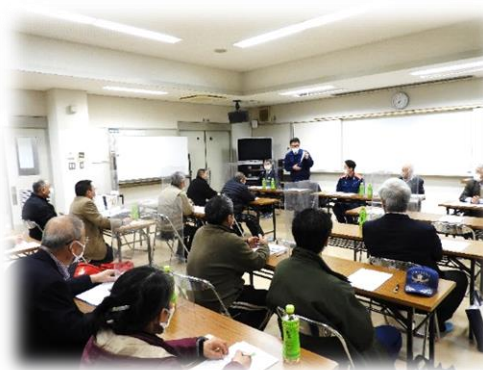
(福山北警察署のお話)