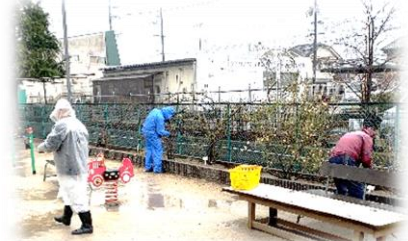
（森脇の作業の様子）