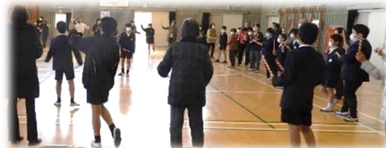
(みんなで一緒に御幸音頭を踊っています)