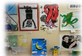
（御幸小学校児童の作品展示）