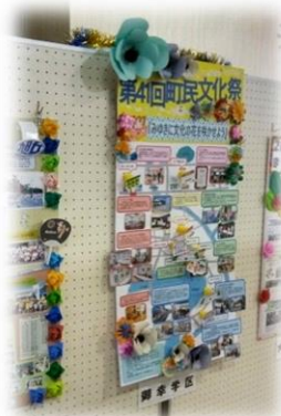
（御幸学区まちづくり活動の掲示）