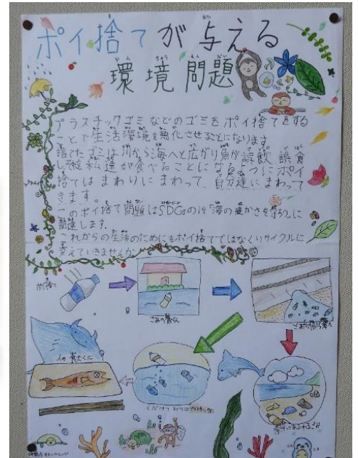
(公民館に掲示してあるポスター)