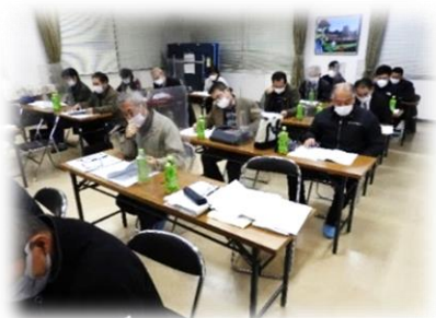
(熱心に説明を聞く参加者)