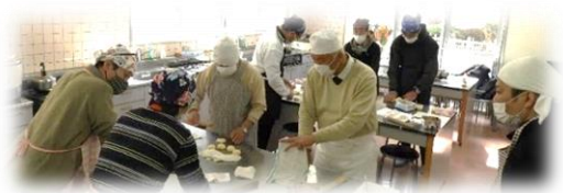
（パンづくりの様子）