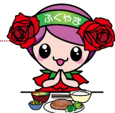
ばらのまち福山イメージキャラクター 「フレイル予防ローラ」

※締め切りは、実施日の1週間前までとさせていただきます。お早めに申込みをお願いします。 ※申込が5人未満の場合は、中止します。その場合は、食生活改善推進員から連絡させていただきます。