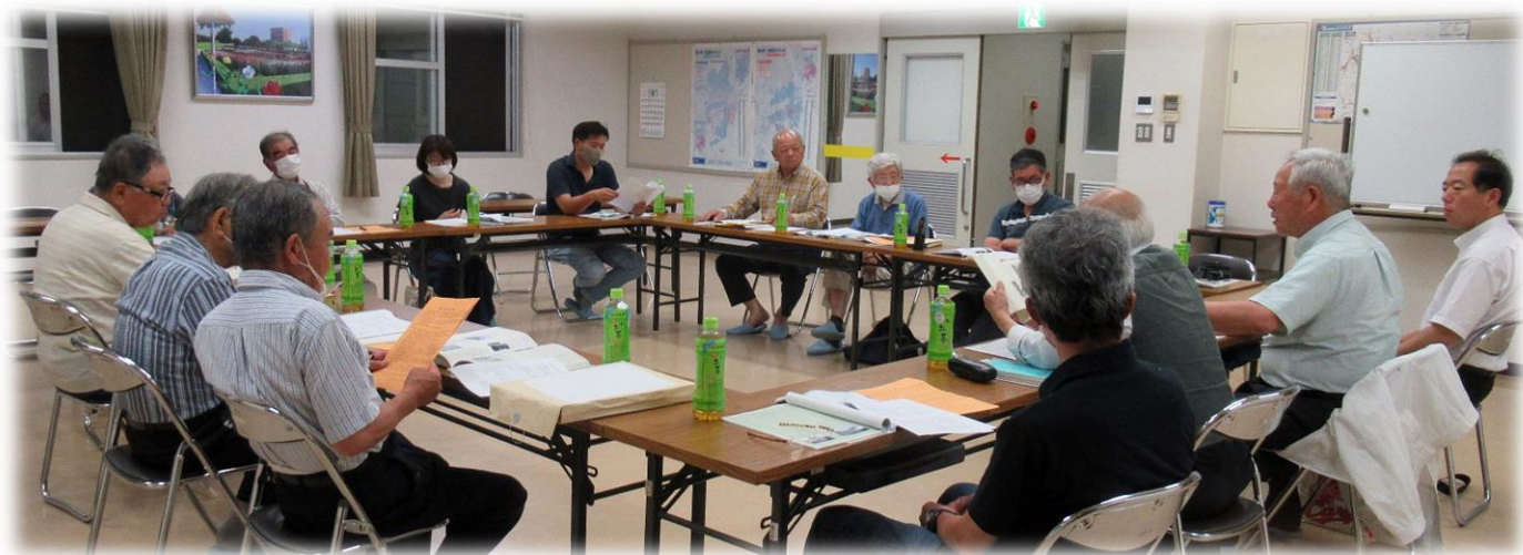
（6月の学習会の様子）

6月の学習会は、6月19日（月）19：30～、御幸交流館2階大会議室で開催しました。