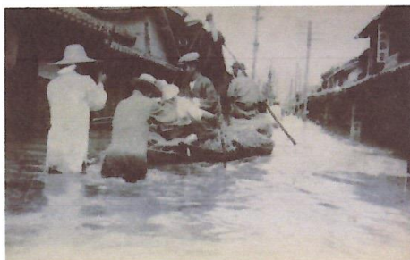
福山市霞町の浸水状況