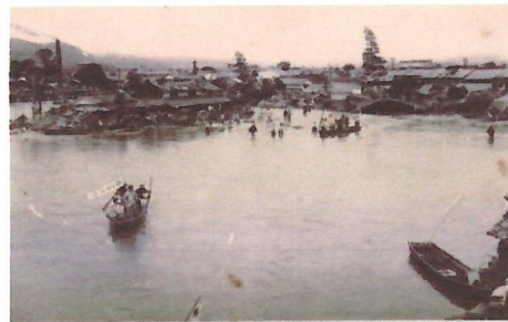
芦田川堤防決壊口(広島県福山市古野上町付近)