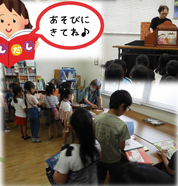
本の貸し出しのようす