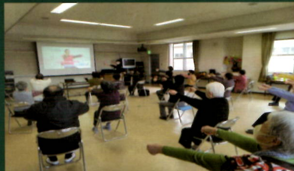
しゃんしゃん御幸