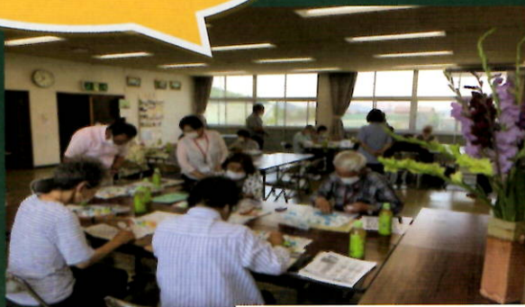
あたま はつらつ 中条教室