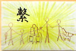
※P.N.はペンネームの略称です。